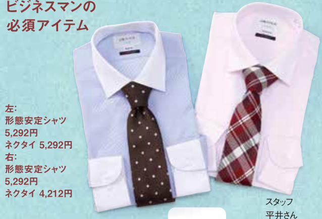
左: 形態安定シャツ 5,292円 ネクタイ 5,292円

ビジネスマンの彼。毎日着るものは、ついつい定番のスタイルに固まってしまうがちですが、そこを押し! プレゼントこそ、ふだんあまり着ない色のシャツ、つけないネクタイを選んで、新しい魅力を開花させるチャンスにしませんか? きっと「意外と似合う! お気に入り!」と、業種や年齢などに合わせてくれる、僕たちがお手伝いさせていただきますので、お気軽にご相談ください。