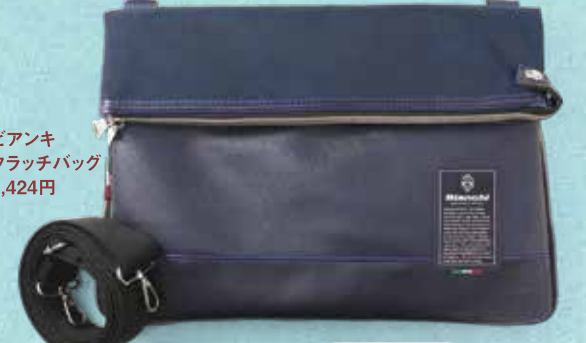
ピアンキ クラッチバッグ 8,424円

人気ブランド「ピアンキ」のバッグは作りが丈夫! ということは勿論なのですが、素材やディテールも優秀なんです。おすすめのクラッチバッグは、ショルダーを付けて2Wayで使用可能。マチの部分がファスナーなので荷物が増えた時は容量をUPして使えます。中も外にもポケットが多く、タブレットを保護するパッドも付いたところも◎。使ってみて更によくなる思いやり! 選んだ人の思いが伝わる贈り物です。