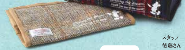
ハリスツイード ×ディズニーコラボ ティッシュケース 各2,592円

自分ではなかなか買わないけれど、プレゼントされたらうれしい! そんなアイテムの一つが、誰の部屋にもあるティッシュボックスケース。リビングで、結構存在感を発揮するインテリア小物だと思いませんか? おすすめは、ハリスツイードとディズニーがコラボしたおしゃれなデザイン。カラーバリエーションも豊富で、大人のアンテナにもピンとくる、リッチな感じの素材感がいいですよ。