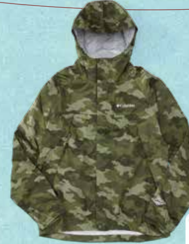
ワバッシュジャケット (オムニテック防水) 15,120円

完全防水のパーカーという、なんとなくちょっとゴワゴワした感じの固めの素材を想像するかもしれませんが、これは柔らかくて動きがとれど楽なところがいい! タウンもスポーツシーンでもどちらでも使える便利なアイテムです。毎日、ついつい手にとってしまうお気に入りの1枚が、プレゼントだったら嬉しい! 小さい収納袋が付いているので、気軽に持ち歩ける場所もおすすめです。