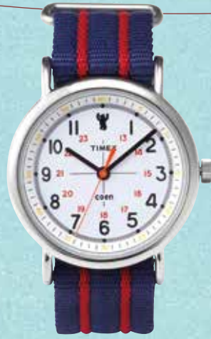
タイムックス ×コーエンの コラボ