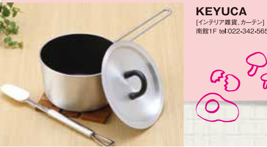
KEYUCA [インテリア・雑貨・カーテン] 南館1F tel:022-342-6561

自宅でシェフ気分が味わえるスタイリッシュなキッチンツールで、料理の腕をUP! 外側がアルミ製、内側がこびりつきにくいテフロン加工なので、ソースづくりなども楽々。シリーズでそろえて自慢のキッチンに。 コンバクトスタイルソーサー 3,240円、フタ 1,026円、ミニスクレーパー 1,404円、Kigumi グラタンマット 313円