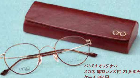
パルミキオリジナル メガネ 薄型レンズ付 21,800円 ケース 864円

彼をちょっとイメチェン! と思ったら、メガネと一緒に選んでプレゼントするのも! オススメのオリジナルモデルは、弾力がある高強度な「βチタン」という素材を使っているところが最大の特徴で、軽く締め付け感が少なく、とにかく心地が抜群。手に持ってみると、しなやかさと軽さに驚かれる方が多いですよ。鼻の上で毎日一緒のメガネこそ、嬉しくなるような一品を選んであげませんか?