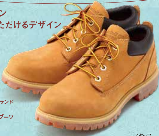
ティンバーランド ヌバック ローカットブーツ 15,120円

丈夫で長持ち、年季が入って更にカッコよく! せっかくなので、定番ブランド、ティンバーランドのローカットブーツは、おなじみのハイカットほどボリュームがないので、ストリートカジュアルから流行のアウトドアファッションまでさまざまなシーンでご活用いただけるおすすめの一品です。今までブーツを履いたことがない方も気軽に履いていただけたらと思います。